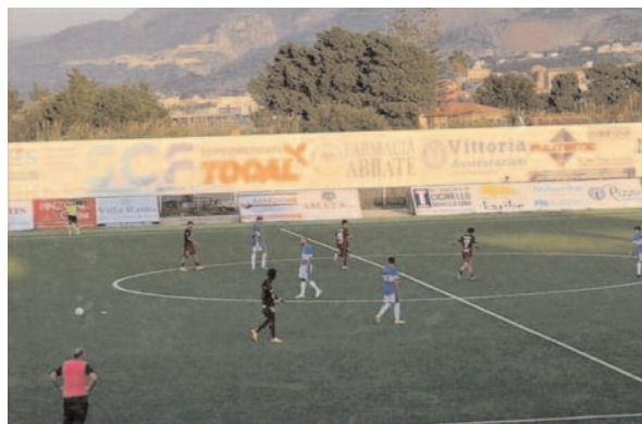
di Tony Carpitella

Dopo la doccia fredda di domenica scorsa e con la certezza di non giocare nel prossimo fine settimana i granata sono scesi in campo ieri pomeriggio al "Biagio Fresina" per guadagnarsi il passaggio del turno nella Coppa Italia di categoria.