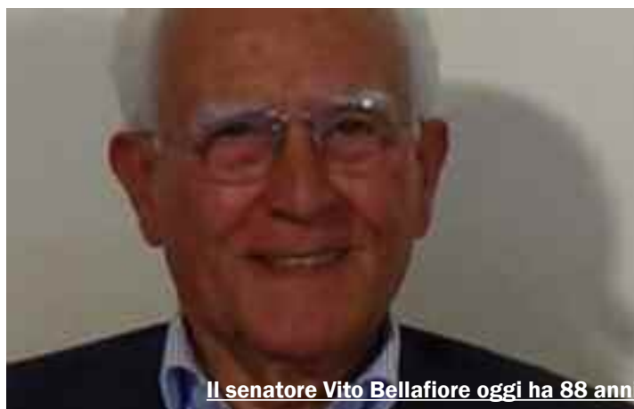
Il senatore Vito Bellafiore oggi ha 88 anni

“E’ stato un inferno. Mancava tutto e nessuno veniva ad aiutarci. E poi quel freddo immenso...”. Era la notte tra il 14 e il 15 gennaio del 1968 e Santa Ninfa crollava su se stessa sus-sultando sotto la spinta di una scossa sismica pari al nono grado della scala Mercalli. “Ho perso molti amici e conoscenti quella notte, è stato davvero terribile”. La voce narrante è quella dell’allora sindaco della cittadina belicina, Vito Bellafiore, classe 1929, che ha fissato in maniera indelebile quei ricordi nella mente. “Raccontare cosa provammo quella notte è quasi impossibile. Solo i sopravvissuti a un tale disastro possono comprendere a fondo lo stordimento, il terrore, la paura mentre la terra non smetteva di tremare. Eravamo soli. Per i primi due o tre giorni nessuno parve accorgersi dell’immane disastro che aveva colpito la Valle del Belice. Poi cominciarono ad arrivare i giovani quarantottini, quelli allora famosi per contestare tutto e tutti, a darci una mano. A cercare di tirare fuori dalle macerie i feriti. Ad accendere i fuochi per scaldare coloro che se pur sopravvissuti al terremoto con-