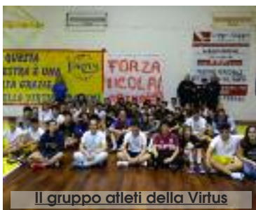
Il gruppo atleti della Virtus

Si è svolta, nella notte tra sabato e domenica scorsi, la settima edizione del "Basket by Night", evento ormai divenuto un classico della chiusura di stagione della Virtus Trapani. Per la prima volta sono stati coinvolti anche tutti i bambini e le bambine del minibasket, in una partita con 140 atleti, iniziata alle 19 per concludersi alle 5 del mattino. Grande divertimento per tutti i ragazzi che a notte fonda hanno fatto uno spuntino: panino con la salsiccia e, per chiudere in dolcezza, i cornetti caldi.