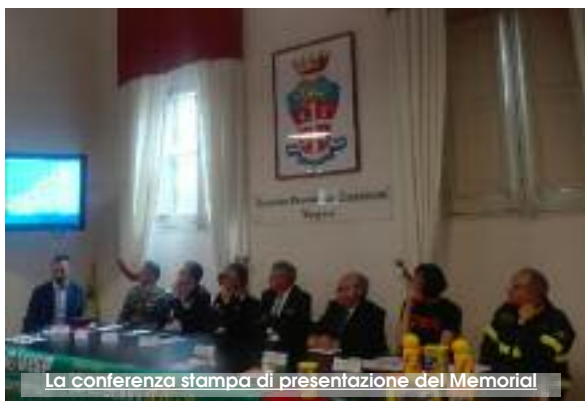
La conferenza stampa di presentazione del Memoriale

tro storico, Villa Margherita, parte di Via Fardella e per ritornare infine al punto d'avvio della gara. Il tragitto è stato pensato con la finalità di attraversare i principali luoghi istituzionali ma anche per ammirare la bellezza paesaggistica del territorio di Trapani. «Abbiamo notizie - dice Russo - di partecipanti anche dal di fuori della Regione Sicilia», si contano circa 500 partecipanti in totale. «Una corsa per la legalità ed un percorso di crescita che ha coinvolto, anno dopo anno, sempre più partecipanti. Il termine "ricordo" diventa equivalente d'impegno» afferma Zagarella. Grazie agli sponsor e alla dotazione, per i partecipanti, di un pacco tecnico (con integratori, maglietta, cappello) la gara è resa più accattivante. Messineo