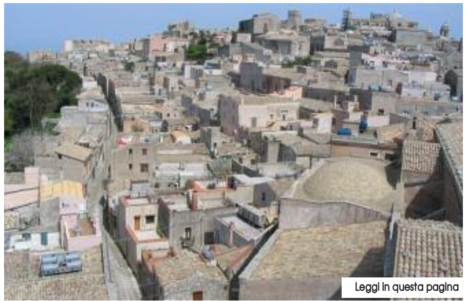
Leggi in questa pagina