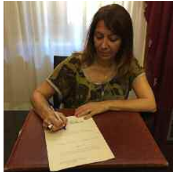
A pagina 3

Si tratta del primo sindaco donna in assoluto per Erice, legittimata da 5910 cittadini ericini che l'hanno portata sulla poltrona di prima cittadina direttamente al primo turno di votazioni, domenica scorsa. Con il suo insediamento, espletate le formalità di rito, abbandona il campo anche il commissario straordinario che era arrivato la settimana scorsa. Ieri sera, festa con i sostenitori.