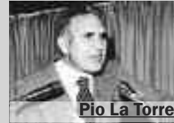
Pio La Torre