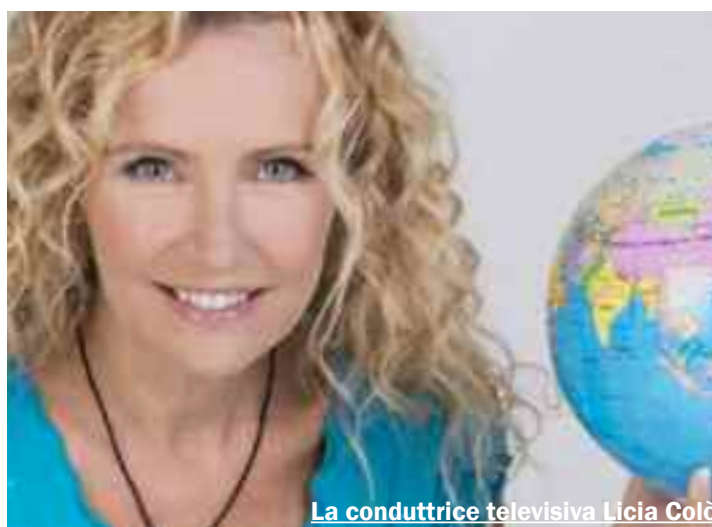
La conduttrice televisiva Licia Colò

Il Gal Elimos è l'ente capofila del progetto, approvato dall'assessorato Turismo Sport e Spettacolo della Regione Sicilia, attraverso il quale s'intende innescare un sistema di promozione del territorio basato sulla valorizzazione delle risorse naturalistiche e sull'utilizzo di forme di comunicazione, diffusione e promo-commercializzazione innovative per un turismo di qualità. In particolare, il progetto prevede di favorire la fruizione degli itinerari naturalistici e degli elementi di pregio artistico-culturale che sono presenti nei territori comunali interessati, lo sviluppo di attività legate al turismo caratterizzate da alti livelli di sostenibilità ed il radicarsi di una forte cultura dell'ospitalità. I temi, inoltre, che sono stati sviluppati nel progetto sono