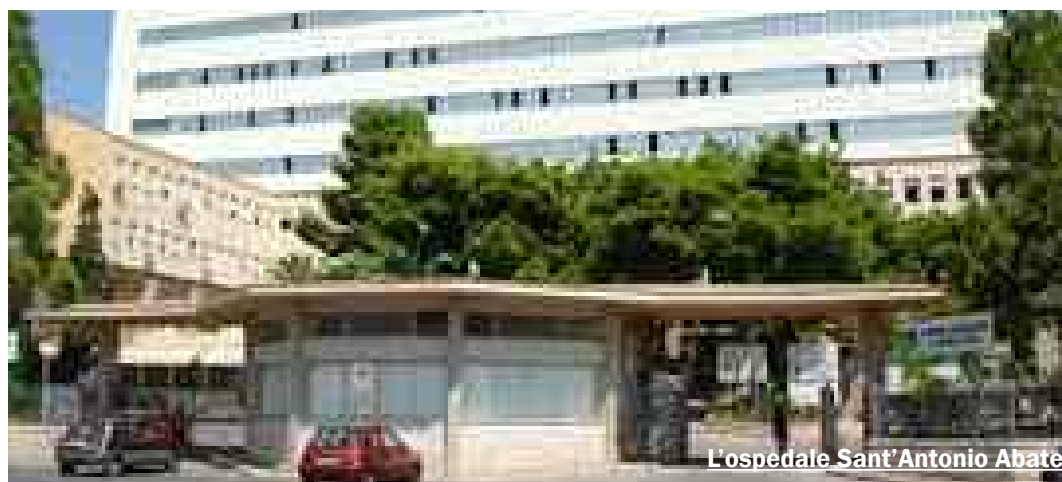
L'ospedale Sant'Antonio Abate