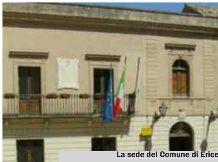
La sede del Comune di Erice