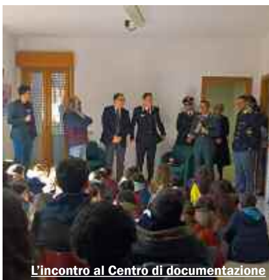
L'incontro al Centro di documentazione