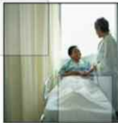
ristorazione cliniche ed ospedali