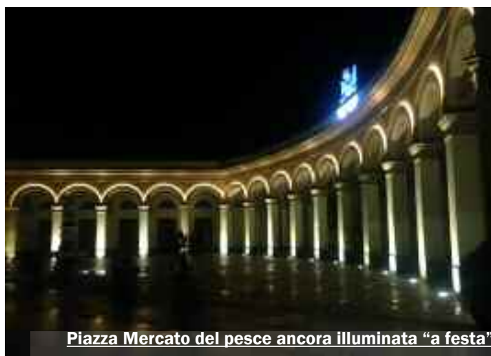
Piazza Mercato del pesce ancora illuminata "a festa"

Non si può più perdere tempo: occorre che proprio in questo periodo il territorio - e mi sento di estendere il concetto a tutta la Sicilia o al meridione in generale - esprima capacità e volontà di fare, che si sappia dare risalto a ciò che di buono e di bello il territorio possiede, tanto apprezzato solo da chi qui non vive. Costruire un'aggregazione di persone di buona volontà che rompa gli schemi precostituiti e asserviti a sigle o simboli che ormai sono inespessivi e vuoti di significato. Un Movimento? Un Circolo? Una Associazione? Un qualcosa che sia fattivo antagonista di partiti non più rappresentativi o, peggio, vuoti simulacri che vivono nel ricordo di una Politica non più esistente. Occorre rifondare la Politica della 'res publica', dell'esclusivo interesse collettivo, del bene comune, bandendo definitivamente la logica delle spartizioni, del clientelismo, del professionismo politico e del favore. Voglio augurarmi che il nostro territorio possa essere 'sconvolto' da