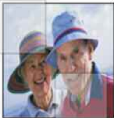
ristorazione case di riposo