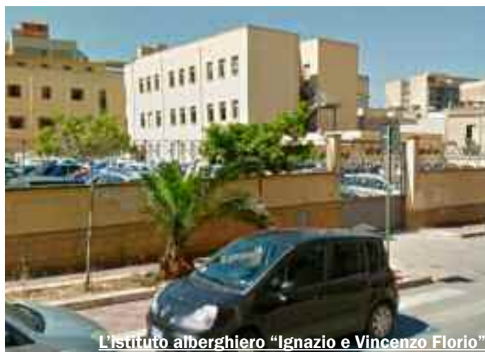
L'istituto alberghiero "Ignazio e Vincenzo Florio"

"Avete una sigaretta?". La richiesta sembrava amichevole. I due studenti non immaginavano che si trattasse solo di una scusa per avvicinarli. E, invece, dopo la richiesta, i due ragazzi hanno iniziato a strattonnarli, si sono impossessati del loro telefono cellulare e di un euro e sono fuggiti via. L'episodio è accaduto lo scorso 13 gennaio, dinanzi l'Istituto alberghiero "Ignazio e Vincenzo Florio" a Casa Santa, nel comune di Erice. I due rapinatori sono riusciti a fare perdere le loro tracce. Un insegnante dell'istituto ha deciso di rivolgersi alla Polizia di Stato. Gli agenti della squadra volante sono riusciti ora a individuare i responsabili. Si tratta di due ragazzi di 16 e 15 anni che vivono in quartieri periferici. Entrambi sono cresciuti in famiglie disagiate. Il padre di uno dei due è stato anche detenuto per gravi reati. I due giovani sono stati denunciati alla Procura della Repubblica presso il Tribunale per i minorenni di Palermo per i reati di rapina aggravata, lesioni personali, violenza privata e minaccia. L'episodio riporta in primo piano il problema del bullismo, un fenomeno sempre più