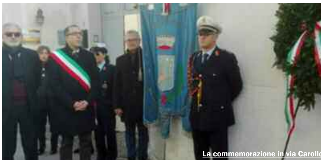
La commemorazione in via Carollo