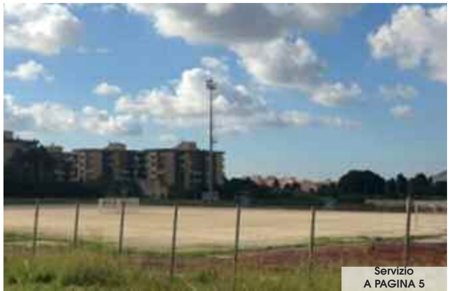
Servizio A PAGINA 5