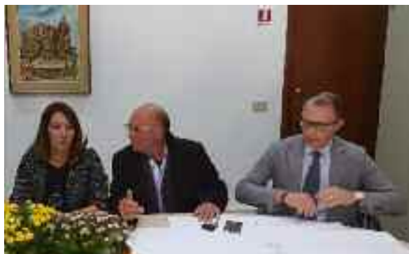
Conferenza stampa di presentazione del campo di Mokarta