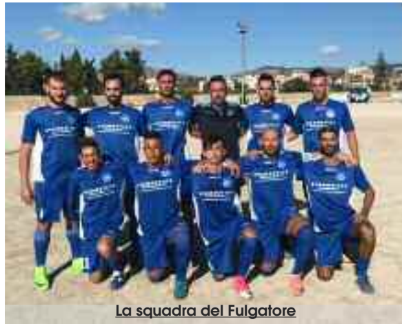
La squadra del Fulgatore

Nella seconda giornata del tanto atteso torneo di Terza Categoria Girone Unico Trapani, da registrare il passo falso del redivivo Borgo Cidà, superato sul campo del Bruno Viviano Partanna. Poi un pareggio e due vittorie