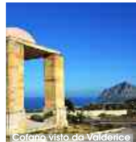
Cofano visto da Valderice