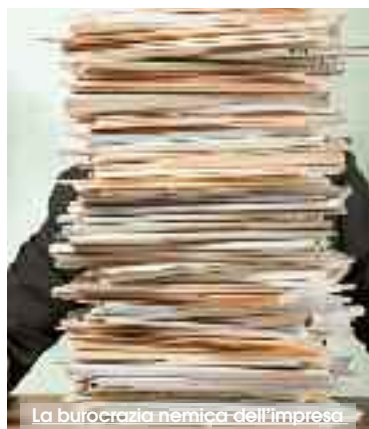
La burocrazia nemica dell'impresa

durere un effetto "rallentamento", il contrario di quanto si vorrebbe ottenere. In pratica il sito impresainungiorno.gov.it è una sorta di collettore obbligatorio per il transito delle istanze. Al punto che alcuni comuni, è accaduto per esempio a Salemi, hanno trasmesso ad imprese e professionisti la comunicazione ufficiale che istanze e richieste non solo non vanno più trasmesse direttamente ai SUAP, ma se trasmesse, anche tramite PEC, non saranno prese in considerazione. Il portale impresainungiorno mette direttamente in contatto gli interessati con i SUAP del Comune che, sempre telematicamente seguirà il procedimento per l'avvio dell'attività o per ogni altro adempimento previsto nel ciclo di vita della impresa. Attraverso lo stesso portale è possibile mettere in connessione i SUAP comunali con gli sportelli delle Camere di Commercio. Il portale inoltre consente all'impresa, in ogni parte d'Italia e d'Europa, di trovare informazioni sul SUAP