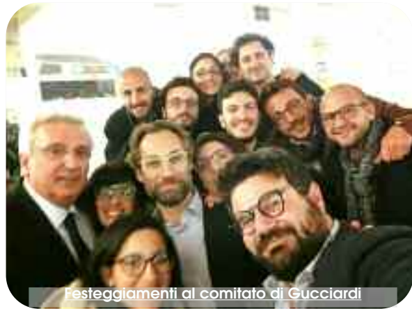
Festeggiamenti al comitato di Gucciardi

Riflessioni a "tiepido" sulle elezioni regionali (a caldo non abbiamo potuto farle per ragioni tecniche indipendenti dalla nostra volontà; il giornale non è uscito, è saltato il cavo Enel che dà energia ai locali della redazione).