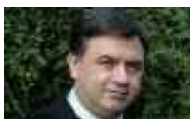
A pagina 7