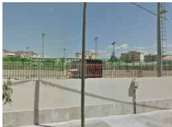
A pagina 3