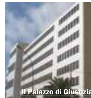
Il Palazzo di Giustizia