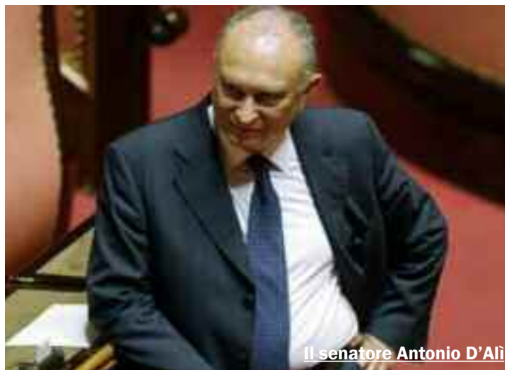
Il senatore Antonio D'Alì