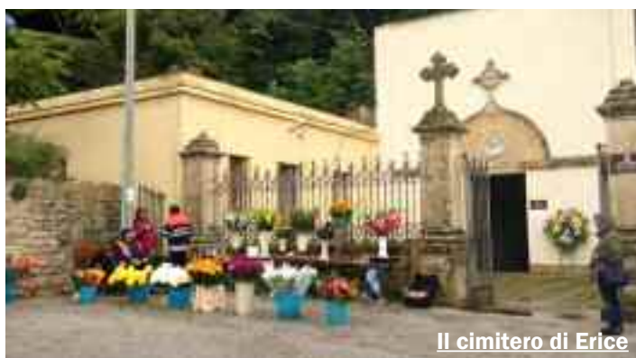
Il cimitero di Erice