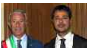
A pagina 7

Gli elettori dei 24 comuni del territorio trapanese hanno deciso in massa di recarsi alle urne. I dati di affluenza superano il 56 per cento: Alcamo e Santa Ninfa i comuni più partecipativi; le Egadi e Pantelleria quelli meno presenti. Il No ha sfiorato il 70 per cento delle preferenze espresse, sulla scia del trend nazionale e regionale. E mentre ora si pensa al dopo-Rezi, i rappresentanti politici locali analizzano e commentano i dati del voto referendario.