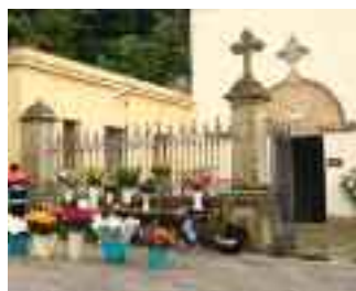
A pagina 9