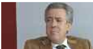
A pagina 5

Il Natale è alle porte ed iniziano i preparativi non solo nelle case private ma anche in quelle pubbliche. Il Comune di Trapani e quello di Erice, però, si preparano diversamente. Il capoluogo pensa alle pulizie invernali e si abbellisce, la Vetta invece pensa a fornire un clima di festa agli ericini.