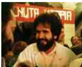
A pagina 7