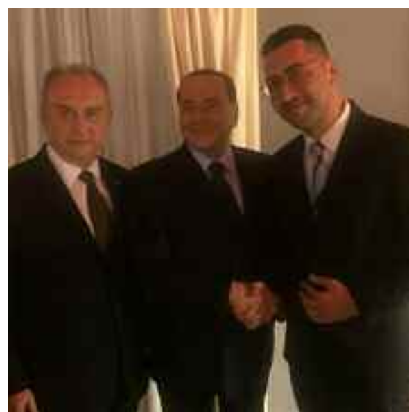
a pagina 4