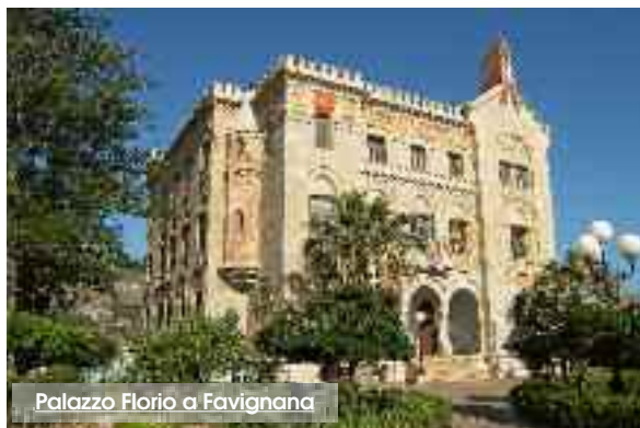
Palazzo Florio a Favignana

dell'ufficio stampa del comune di Favignana prevede «il restauro della veranda in ghisa e ferro; il completamento del restauro del prospetto retrostante la veranda in ghisa; i lavori di ultimazione del secondo piano (rifacimento delle pavimentazioni - rimozione e rifacimento degli intonaci ammalorati - realizzazione dei servizi igienici - rifacimento dell'impianto elettrico e di sicurezza); gli interventi di manutenzione e di consolidamento delle capriate in legno e degli arcarecci del solaio di copertura in legno, e il completamento dell'impianto di climatizzazione limitatamente al piano secondo. Così come per gli altri piani, sarà ripristinato il sistema di pavimentazione bicromatico già esistente al piano nobile e al piano rialzato, utilizzando mattoni