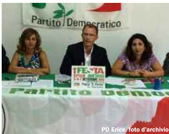
PD Erice