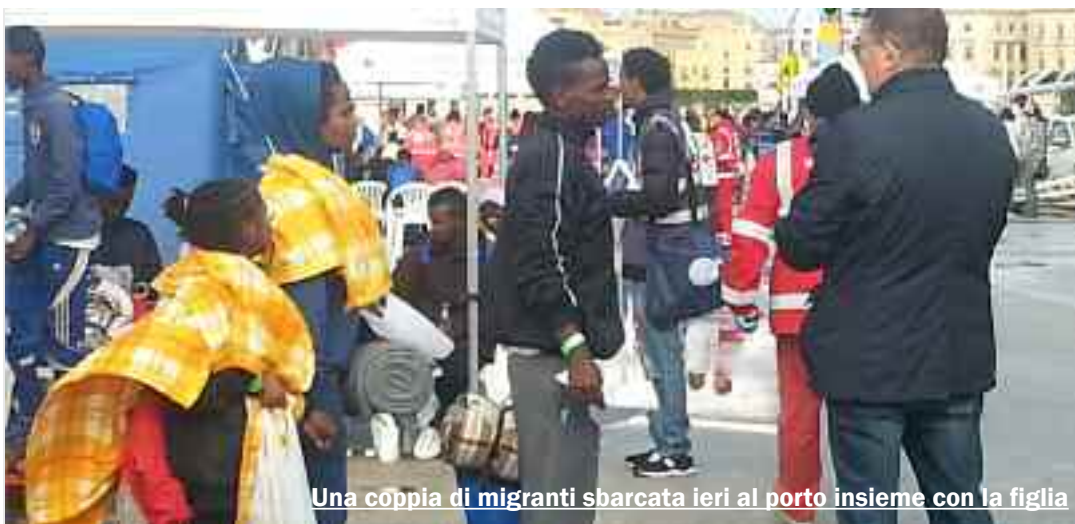
Una coppia di migranti sbarcata ieri al porto insieme con la figlia

Non lascia mai la mano della mamma. Si guarda in giro, con occhi spauriti. Indossa una tuta nera e uno zainetto rosso, come quelli che tanti bambini usano per andare a scuola. Per lei, però, arrivata insieme con il padre e la madre dall'Africa, il domani è incerto. C'erano anche 22 bambini tra 797 migranti giunti ieri mattina al porto di Trapani a bordo della nave "Burbon Argos", di Medici senza Frontiere. Ad accoglierli, al molo Ronciglio, hanno trovato gli operatori della Croce Rossa Italiana, i volontari delle associazioni di Protezione civile e gli incaricati di Unher, Oim, Save the Children e Medici senza Frontiere. Provengono da Eritrea, Bangladesh, Tunisia, Nigeria, Libia, Etiopia, Sudan, Somalia e Siria. Sono stati soccorsi, al largo della Libia mentre stavano tentando di raggiungere le coste italiane a bordo di due imbarcazioni di legno. Per 83 di loro, risultati affetti da scabbia, è stato necessario procedere all'isolamento per l'avvio del trattamento medico. Duecento, subito dopo lo sbarco, sono stati immediatamente trasferiti in