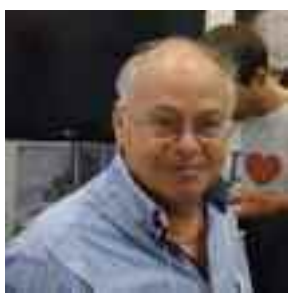
Biagio Martorana Sindaco di Paceco