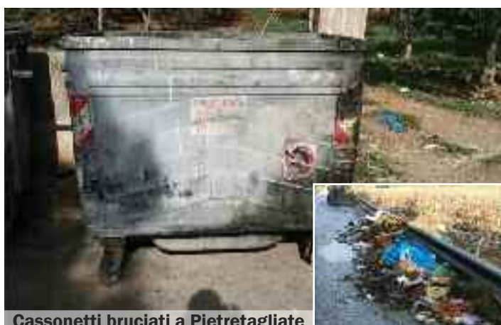
Cassonetti bruciati a Pietretagliate