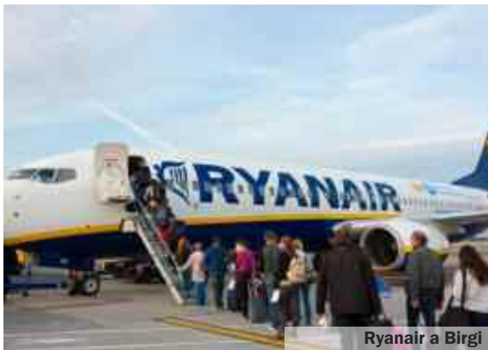
Ryanair a Birgi

Qualcosa si muove, dunque, per il futuro dello scalo aeroportuale trapanese e per l'economia dell'intero territorio. Anche in considerazione del fatto che è già novembre inoltrato e a breve scadrà la proroga concessa dalla compagnia di volo irlandese