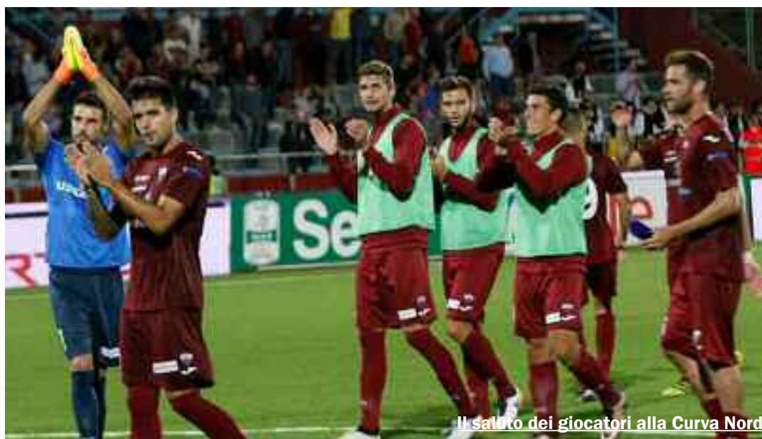
Il saluto dei giocatori alla Curva Nord

Signori miei, il Trapani non è risorto. Il Trapani ha solamente vinto, rispettando alla lettera quando indicato dal mister prima della partita. Se escludiamo le brutte trasferte di Salerno e Bari (se fosse entrato in rete il pallone calciato da Petkovic stampatosi sulla traversa avremmo assistito a ben altra gara), la squadra ha, senza ombra di dubbio, disputato gare migliori sul piano del gioco rispetto a quella giocata contro i campani di Baroni. Il caso o il destino, magari accompagnati dal mancato rispetto di schemi dettati da Cosmi, hanno determinato la mancanza di risultati che ha accompagnato la squadra nelle precedenti gare. Non dimentichiamo che il Trapani, inizialmente, era da considerare (e lo è ancora) un neonato che sta cominciando a fare i primi passi. Gli schemi si assimilano pian piano e si cresce di partita in partita. Non si può diventare fenomeni improvvisamente. Contro il Benevento, ad esempio, un certo Legittimo, che prima aveva messo in campo un rendimento al di sotto della