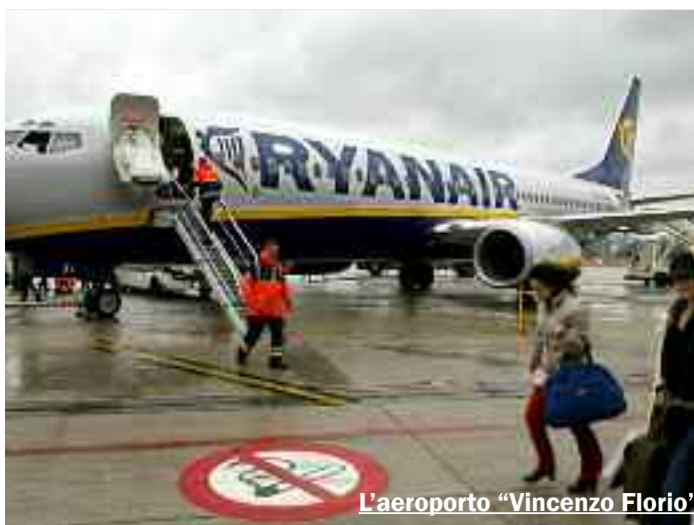
L'aeroporto "Vincenzo Florio"