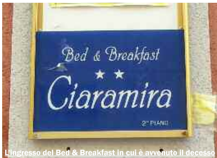
L'ingresso del Bed & Breakfast in cui è avvenuto il decesso