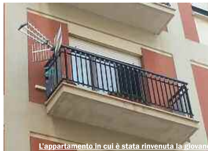
L'appartamento in cui è stata rinvenuta la giovane