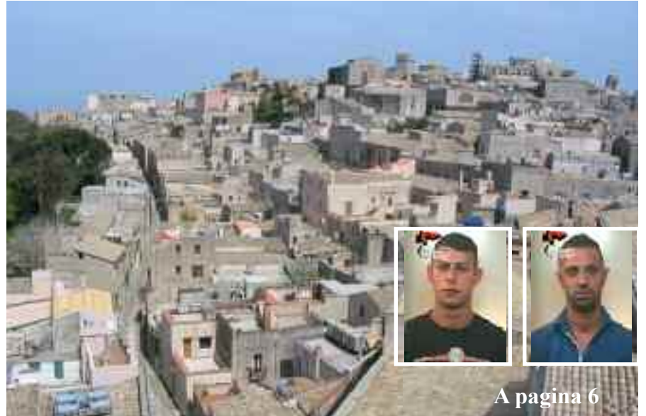
A pagina 6