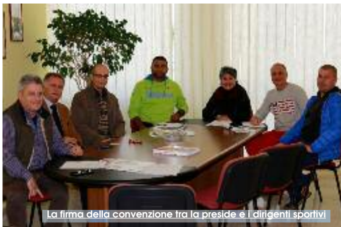
La firma della convenzione tra la preside e i dirigenti sportivi