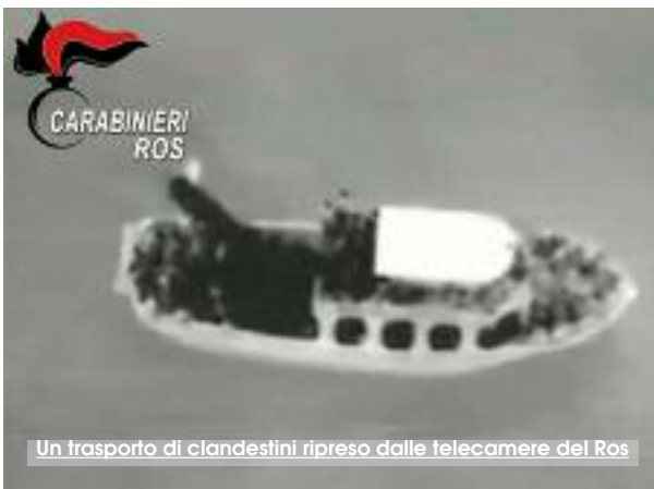
Un trasporto di clandestini ripreso dalle telecamere del Ros

Il trasporto di clandestini e sigarette di contrabbando tra le coste tunisine e la Sicilia e l'ombra di Daesh e del terrorismo internazionale di matrice islamica si profilano dietro l'operazione del Raggruppamento Operativo Speciale dei Carabinieri che ieri hanno fermato 8 persone tra le province di Palermo, Trapani, Caltanissetta e Brescia, mentre altre 7 sono latitanti. I 15 provvedimenti di "fermo di indiziato" sono stati emessi dalla Procura Distrettuale di Palermo. Gli indagati sono ritenuti, a vario titolo, responsabili di istigazione a commettere delitti in materia di terrorismo, associazione per delinquere finalizzata al favoreggiamento dell'immigrazione clandestina e al contrabbando di Tabacchi lavorati Esteri ed esercizio abusivo di attività di