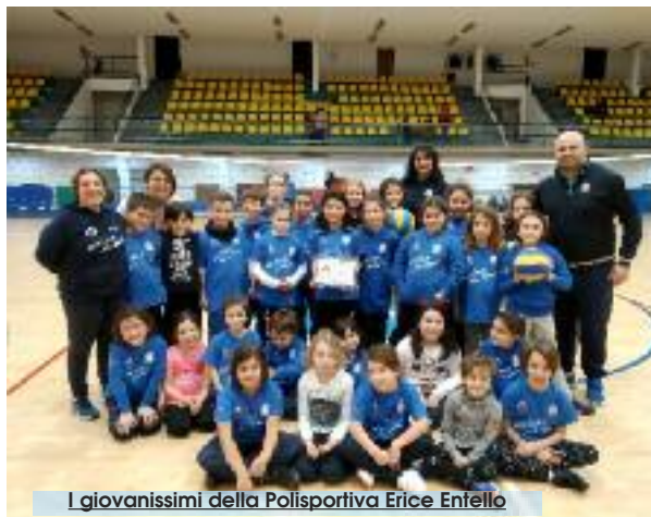
I giovanissimi della Polisportiva Erice Entello

Prova di forza, invece, per la formazione maschile della Polisportiva Erice Entello che domenica ha vinto con un secco 3 a 0 contro la Hobby Volley. Gara in apparenza difficile ma in campo i ragazzi di coach Vulpetti hanno fortemente voluto la vittoria. Primo set giocato con attenzione e con pochi errori lasciando gli ospiti a 19. Il secondo è senza storia: largo il vantaggio tanto da permettere a Vulpetti di dare spazio a tutto il roster chiudendo il set 25-11. Nel terzo parziale, giocato punto a punto, qualche disattenzione ed errori di troppo da parte degli entellini, l'Hobby Volley non riesce a sfruttare il mo-