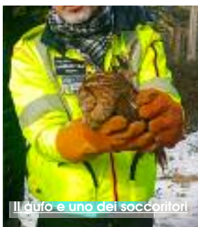
Il gufo e uno dei soccorritori