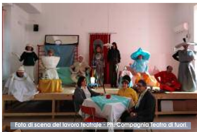
Foto di scena del lavoro teatrale