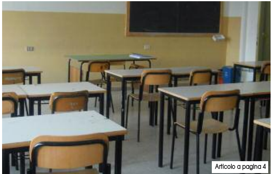
Articolo a pagina 4