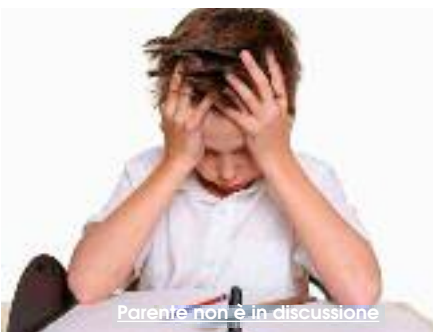
Parente non è in discussione

Questo pomeriggio dalle 15.15 alle 17.30 l'ultimo incontro presso l'Auditorium dell'Istituto "G. Pagoto" in Via Francesco La Sala, n. 8 di contrada Rigaletta Pegno con la plenaria. Poi il 12 ed il 14 Dicembre, dalle 10 alle 11.30 con l'ascolto e