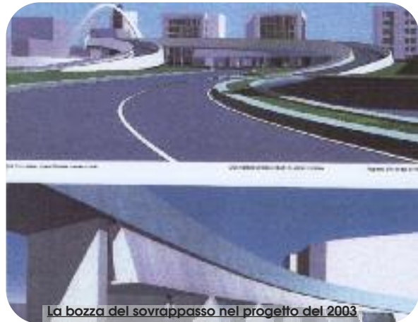
La bozza del sovrappasso nel progetto del 2003

La ricerca di soluzioni destinate a bypassare i binari che attraversano parte della città è storia vecchia. Parte da lontano e spesso è stato ottusamente ignorato un presupposto fondamentale: i treni devono condurre nel cuore delle città. Basta una campionatura perfino approssimativa per ottenerne sempre conferma, da Londra, Madrid, Parigi, Milano. Pure da Catania e Palermo, tanto per non scomodare il Continente. Qui, invece, si è insistito troppo sul trasferimento della stazione, operazione che avrebbe inflitto alla città un'ulteriore penalizzazione.