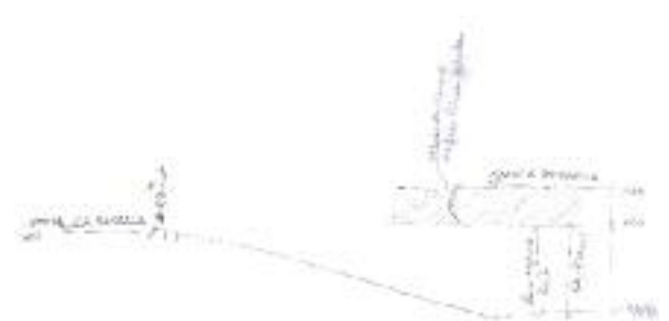
Lo schema delle quote tra via Marsala e il sedime ferroviario

liarità dei tecnicismi, uno schizzo potrebbe sicuramente risultare maggiormente esaustivo, rendere meglio l'idea, ecco. Detto fatto e quanto verbalmente illustrato finisce su carta, così, velocemente. Intanto giusto per capire meglio, si diceva: tecnologie da evitare in futuro? Può darsi, ma eventualmente e nella peggiore delle situazioni. Però, intanto, toccando ferro e con i dovuti scongiuri, ci si permette di esprimere il dubbio.