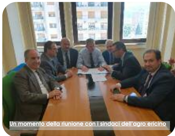
Un momento della riunione con i sindaci dell'agro ericino

L'opinione pubblica è frastornata da non capire ormai dove stiano la verità o le fake news. Si capisce che il dialogo delle ultime settimane è stato drogato da almeno alcuni fattori, intanto le elezioni europee, ma soprattutto le prossime elezioni del 30 giugno per eleggere il Presidente della provincia. In questo clima più che di informazione c'è bisogno di "procurare guerra", anche perché Trapani l'aeroporto ormai se l'è giocato! Birgi, presto o tardi, sarà proprietà del neo Comune di Misiliscemi.