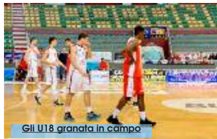
Gli U18 granata in campo

La formazione Under 18 Eccellenza della Conad Trapani nelle giornate di oggi e domani sarà impegnata a Senigallia (AN) nei "Concentramenti" per l'ammissione alle Finali Nazionali di categoria che si terranno a Milano dal 7 al 9 giugno. La squadra guidata da coach Fabrizio Cannella è arrivata a tale qualificazione grazie al quarto posto conquistato nella prima fase del torneo Under 18 Eccellenza "Giancarlo Primo" e poi attraverso la seconda postazione ottenuta nella seconda fase del campionato, dove ha affrontato Varese, Brindisi e San Vendemiano. La Conad Trapani è stata inserita nel girone B, insieme alla Polisportiva Don Bosco Livorno e Oxygen Bassano. La formula prevede che solamente la prima classificata del girone sarà ammessa alle Finali Nazionali alle quali parteciperanno le migliori otto realtà dell'Italia. Un risultato già storico raggiunto dai giovani granata,