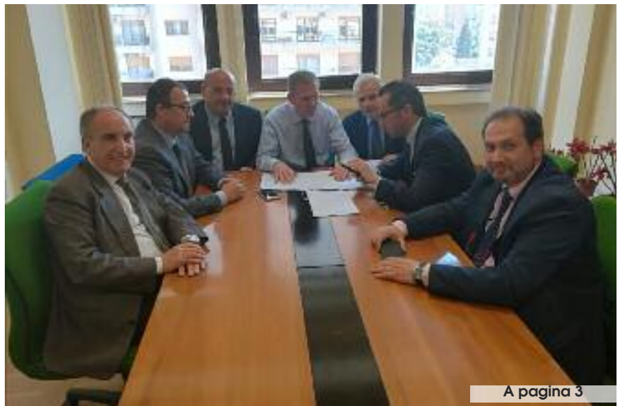
A pagina 3