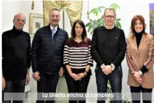
La Giunta ericina di completo

cui il progetto di riqualificazione energetica degli impianti di pubblica illuminazione per 5 milioni di euro, la realizzazione di un'area attrezzata con l'agility dog per la sgambatura di cani all'interno della cittadella della salute per circa 100.000 euro, gli interventi di messa in sicurezza degli edifici comunali e scolastici per altri 240.000 euro; gli investimenti serviranno, inoltre, per il completamento delle opere già in appalto, come il contratto di Quartiere di San Giuliano, i cui lavori sono in fase di completamento per un valore di circa 700.000 euro, il Piano delle Città, anch'esso in fase di completamento nella zona di San Giuliano per quasi 4 milioni di euro, gli "Interventi di recupero finalizzati al miglioramento della qualità della vita e dei servizi pubblici" nel centro storico per circa 1 milione di euro, il Campo Sportivo Villa Mo-