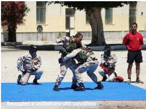
Bersaglieri si addestrano alla autodifesa

Ventiquattro donne trapanesi seguono un corso di difesa personale, tenuto dagli istruttori del 6 reggimento Bersaglieri di Trapani. Come nasce questa iniziativa? È lo scorso dicembre quando il Comune di Trapani, in linea con i principi dell'Unione Europea volti a perseguire l'obiettivo della parità di genere e alla non discriminazione, bandisce la selezione di iniziative presentate da organizzazioni no profit, nell'ambito del progetto "Trapani è donna" che si focalizza, a sua volta, in maniera trasversale, sui seguenti punti: aumento della partecipazione delle donne al mercato del lavoro e pari indipendenza economica; lotta contro la povertà delle donne; lotta contro la violenza di genere e sostegno a favore delle vittime; promozione della parità tra donne e uomini..