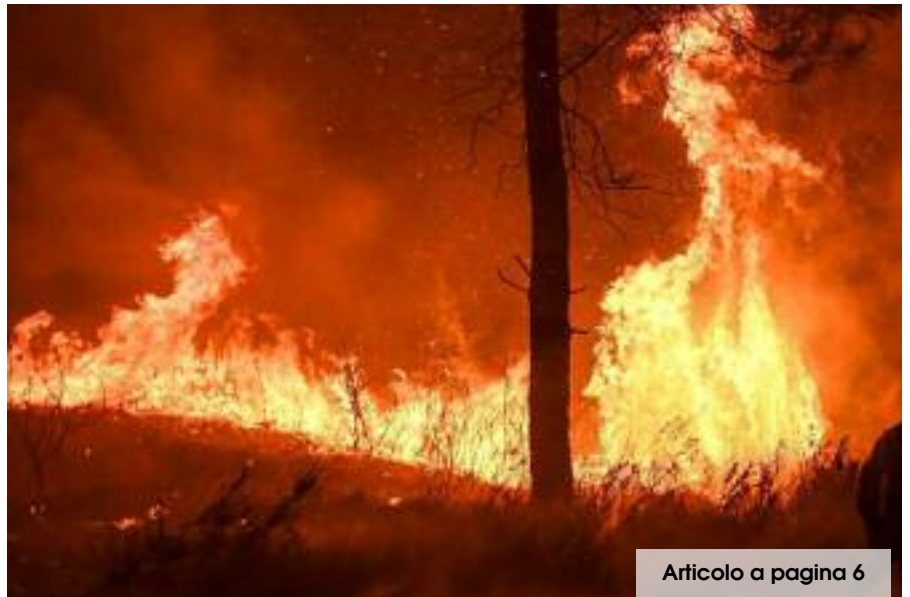
Articolo a pagina 6