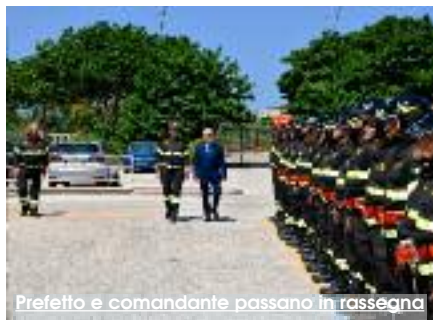
Prefetto e comandante passano in rassegna