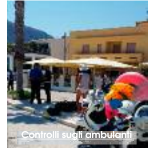
Controlli sugli ambulanti

Polizia Municipale, Carabinieri e Guardia Costiera di San Vito Lo Capo nella mattinata di ieri hanno condotto una serie di controlli per arginare la vendita di prodotti contraffatti e il commercio ambulante abusivo in spiaggia e nelle immediate vicinanze. Il commercio ambulante è regolato oltre che dalle normative vigenti anche da una ordinanza sindacale volta a dare decoro alla spiaggia e ad alcune zone del paese. Nel corso dei controlli sono stati identificati 15 ambulanti abusivi e sono state comminate sanzioni per un valore complessivo di 2.600 euro. Per il sindaco di San Vito Lo Capo, Giuseppe Peraino «il rispetto delle regole da parte di