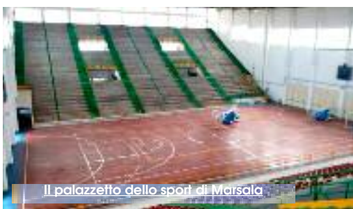
Il palazzetto dello sport di Marsala

Riapre il Palazzetto dello Sport di Marsala con una cerimonia che è stata fissata per martedì 2 luglio, alle ore 20,30. Dopo oltre 13 anni (era il dicembre del 2005 quando venne chiuso) riapre l'impianto che, per un paio di decenni è stato punto di riferimento per gli eventi sportivi e di spettacolo della Sicilia Occidentale. La cerimonia "inaugurale" prevede vari momenti d'intrattenimento, l'esibizione di atleti impegnati in diverse discipline sportive e la partecipazione di Ignazio Boschetto de "Il Volo". L'impianto di Marsala lo scorso anno è stato oggetto di un bando di affidamento. Gara che è stata vinta dall'Asd Le Ali di Marsala, l'associazione sportiva che pratica pallamano e che era arrivata seconda in graduatoria nel bando di assegnazione. Il palazzetto le è stato assegnato dopo la rinuncia della Polisportiva Boeo. Nei locali della sala Giunta al palazzo Municipale si è tenuta ieri una conferenza stampa nel corso della quale il sindaco, Alberto Di Girolamo, ha sottolineato quanto sia importante per la comunità sportiva marsalese la riapertura e la fruizione di un impianto di questo rilievo. (F.T.)