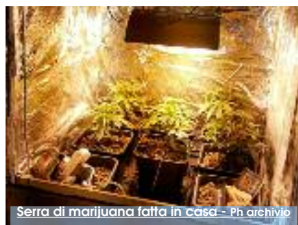
Serra di marijuana fatta in casa

Da più di un anno avrebbe rubato energia elettrica per "illuminare" e far crescere le sue piantine di marijuana pazientemente coltivate in appartamento. Protagonista un uomo di 59 anni che gli agenti della squadra Pegaso del Commissariato di Mazara del Vallo hanno arrestato con l'accusa di detenzione ai fini di spaccio di sostanza stupefacente e furto aggravato di energia elettrica. Gli agenti da tempo tenevano sotto controllo l'uomo e, soprattutto, la sua abitazione, una villetta in via San Giuliano. Giovedì scorso, con al seguito i tecnici dell'Enel, gli agenti della Pegaso hanno fatto irruzione nella casa di P.S. dove hanno sei piantine di cannabis alte un metro e mezzo e 30 grammi di marijuana già essiccata e pronta per il consumo. E ancora: 5 grammi di hashish, una gabbia per uccelli rivestita di cellophane, trasformata in un incubatoio per i semi di marijuana, materiale d'uso per la coltivazione in serra, due fari per simulare il ciclo giorno/notte, e un bilancino, perché negli