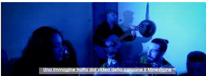
Una immagine tratta dal video della canzone Il Minestrone

Chiamiamole maschere oppure corde (alla maniera pirandelliana). Chiamiamolo istinto di sopravvivenza, ego, adattamento... qualunque sia il termine utilizzato ci si renderà conto che