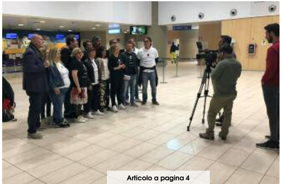
Articolo a pagina 4