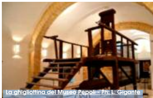
La ghigliottina del Museo Pepoli