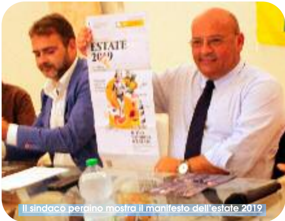
Il sindaco peraino mostra il manifesto dell'estate 2019