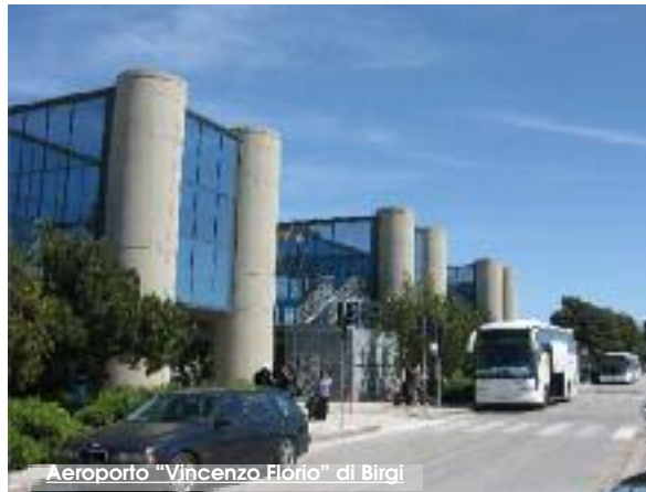
Aeroporto "Vincenzo Florio" di Birgi

Una manifestazione generale che ha lo scopo di "mobilitare" le classi dirigenti in merito alle sorti dell'aeroporto "Vincenzo Florio" di Birgi. Si terrà domani mattina a Trapani. La proposta nasce a seguito di un "movimento" nato sul social network Facebook. Tutti i partecipanti si concentreranno, con inizio alle ore 9, presso la piazza Vittorio Emanuele da dove poi si sposteranno a Marsala. Gli organizzatori, infatti, hanno saputo che nel marsalese, nella stessa mattina, si svolgerà un incontro per il progetto dell'Area Vasta, a cui saranno presenti, tra gli altri, il sindaco di Palermo Leoluca Orlando, diversi rappresentanti politici tra cui il sindaco di Marsala e altri esponenti delle Istituzioni e inoltre si presuppone saranno presenti all'incontro anche rappresentanti dell'Air-