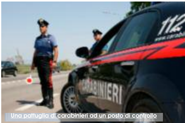
Una pattuglia di carabinieri ad un posto di controllo