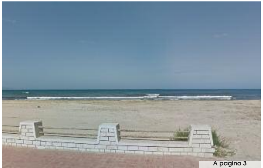
A pagina 3