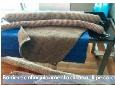
Barriere antinquinamento di lana di pecora

Sapete che la lana di pecora è un efficace strumento in grado di contrastare l'inquinamento? Ebbene sì! Non dal nulla infatti il «GAC-FLAG Isole di Sicilia», nella cornice di Palazzo Florio a Favignana