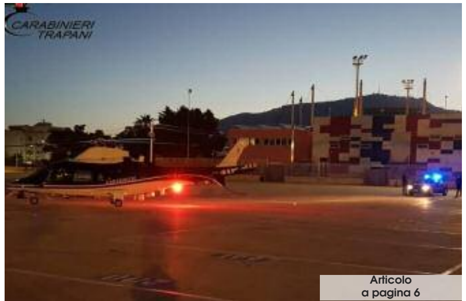
Articolo a pagina 6