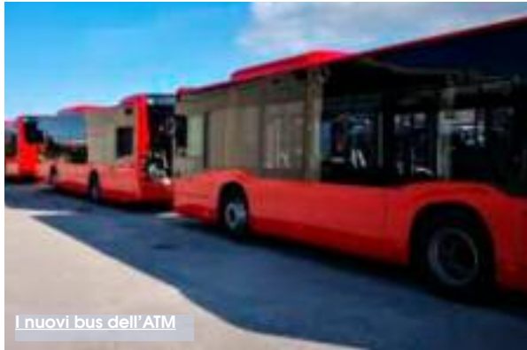
I nuovi bus dell'ATM

corso interno e al "Regolamento per la progressione di carriera". Appunti e osservazioni di varia natura, ma mai viene avanzata una contestazione di tipo tecnico giuridico che consentirebbe di minacciare, ed eventualmente praticare la via legale dell'impugnazione del bando. Insomma una contestazione più sulla forma che sulla sostanza. Il sindacato arriva al punto da suggerire il recupero di un vecchissimo Regio Decreto del 1931 (art. 19 R.D. 148/31) in caso di parità di parità di anzianità e di punteggio tra i concorrenti. Secondo Soggetto Giuridico «nel precedente regolamento sulla progressione di carriera il tutto era molto più chiaro». L'A.U.