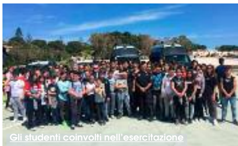
Gli studenti coinvolti nell'esercitazione

Si è svolta a San Vito Lo Capo, nei campetti di calcio di via Faro, un'esercitazione del reparto di Soccorso del 12 Reggimento Carabinieri Sicilia. Simulando un evento sismico, i militari, al comando del colonnello Salvatore Sgroi, hanno allestito, in tempi celeri, un campo per accogliere gli sfollati montando tende, cucine e un ospedale e creando una centrale operativa con un ponte radio di collegamento per assicurare la comunicazione con gli altri centri operativi. Effettuata anche la simulazione di un'operazione "antisciacallaggio", per prevenire i furti nelle abitazioni e nei negozi, chiudendo alcune strade al traffico veicolare e pedonale. Un'esercitazione a tutto campo, con un intervento dall'alto di un elicottero. Alla cerimonia dell'alza bandiera sono intervenuti il prefetto di Trapani, Tommaso Ric-