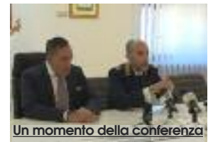
Un momento della conferenza