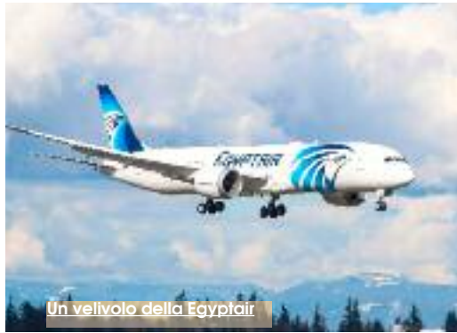
Un velivolo della Egyptair