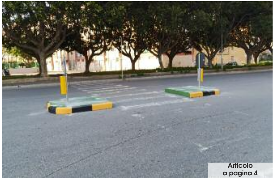
Articolo a pagina 4