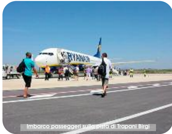
Imbarco passeggeri sulla pista di Trapani Birgi