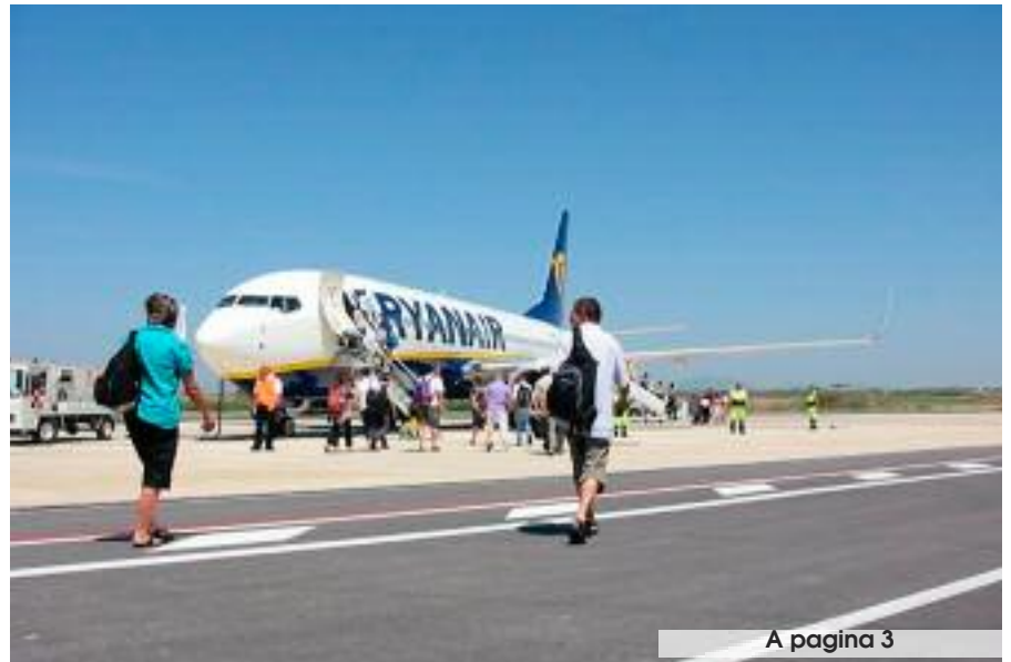
A pagina 3