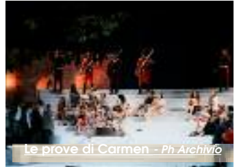
Le prove di Carmen

L'Ente Luglio Musicale trapanese seleziona 5 figuranti per l'opera Carmen che andrà in scena il 14 e il 16 luglio al Teatro open air "Giuseppe Di Stefano" a Trapani. In particolare, i connotati fisici richiesti ai quanti vogliono partecipare alle selezioni sono: giovani di età compresa tra i 18 e 26 anni, prestanza fisica e preferibilmente bella presenza. Tali requisiti sono giustificati dalle necessità sceniche, è infatti richiesta la disponibilità dei figuranti a stare in scena a torso nudo. La selezione è prevista per giovedì 27, a partire dalle 11 presso la sede dell'Ente Luglio Musicale trapanese in Largo San Fran-