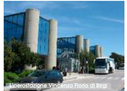
L'aerostazione Vincenzo Florio di Birgi

andato prevedibilmente a vuoto. Vero è che quello che non ti uccide ti rende più forte, ma il bambino è regredito, abbiamo perso 10 anni. Crescere un bambino richiede tempo e denaro. Gli investitori privati potrebbero avere il denaro, se si realizzassero condizioni, che al momento non sussistono. Creare queste condizioni è compito dei Governi nazionale e regionale e delle amministrazioni locali. Al momento, per quanto riguarda i piccoli aeroporti, dovrebbe iniziare a fare molto, ma molto di più, il Governo nazionale. Nel caso dei piccoli aeroporti, il problema, però, è il tempo. Sviluppare un piccolo aeroporto, qualora un Governo nazionale lo rendesse nuovamente possibile, richiede così tanto tempo, soprattutto nelle aree periferiche e sottosviluppate del Paese, che è spesso velleitario sperare di trovare investitori privati che abbiano orizzonti temporali compatibili. Soprattutto quando è sotto gli occhi di tutti quanto poco basti per far perdere rapidamente 10 anni di sviluppo. Sarebbe ora che Governo nazionale, Governo regionale e enti locali ini-