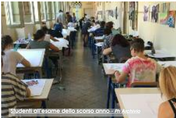
Studenti all'esame dello scorso anno

Due maturandi chiacchierano tra di loro. Uno dice all'altro: «Ho trovato un sito che pubblica in anticipo le tracce previste per l'esame di maturità di quest'anno. Una soffiata che di sicuro, ci permetterà di superare la prima prova ad occhi chiusi». L'altro risponde: «Non m'interessa proprio... Non lo sai ancora che durante l'esame tutti i telefonini degli studenti sono sotto il controllo della polizia?». Questo fantomatico frammento di conversazione, stando alle statistiche di Skuola.net, non sarebbe poi così insolito. Secondo le ricerche fatte su alcuni studenti che si accingono a sostenere gli esami di Stato, pare che 1 su 6 di loro, sia convinto che su internet si possano trovare le tracce d'esame prima del tempo. Inoltre, 1 su 5 è convinto di essere spiato dalla Polizia durante