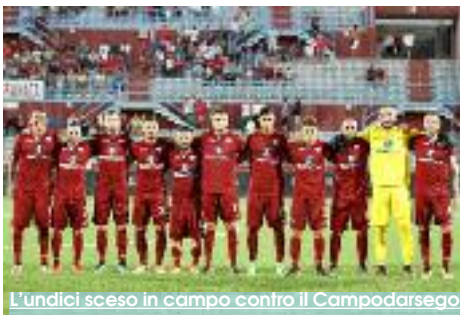
L'undici sceso in campo contro il Campodarsego

Alla vigilia della partita di Coppa Italia tra Trapani e Campodarsego, disputata lo scorso 29 luglio, le incertezze erano tante e non era stata definita neppure la guida tecnica dei granata. Il nome più ipotizzato che doveva guidare una formazione imbotita di giovani fu quello di Stefano Firicano, che aveva allenato la squadra in quella settimana di preparazione al match e che poi è rimasto come collaboratore tecnico. Ventiquattro ore prima, però, del match di Coppa Italia è giunta a sorpresa la firma di Vincenzo Italiano. Un esordio da professionista da allenatore con il Trapani Calcio, dopo quello, fatto sempre con la maglia granata da calciatore.