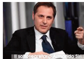
Il sottosegretario Armando Siri

negli uffici dell'Assessorato regionale all'Energia. Emerge anche una pista politica. Nicastrì si sarebbe mosso per fare approvare a livello nazionale una normativa per ottenere ancora possibilità di investimento e incentivi nel campo delle energie alternative. Terminale di questa strategia sarebbe stato l'attuale sottosegretario per le Infrastrutture e senatore della Lega Armando Siri cui sarebbe stata destinata, secondo le intercettazioni, una tangente di 30mila euro. Non vi sarebbe però prova dalla "dazione" del denaro. Tra gli indagati un altro personaggio vicino alla Lega e a Salvini. Si tratta del docente universitario Paolo Arata, genovese, 68 anni, ex deputato nazionale di Forza Italia. Arata che è indagato corruzione e intestazione fittizia di beni secondo gli inquirenti sa-