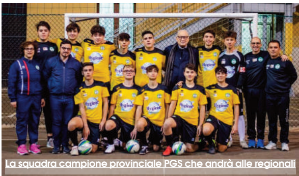
La squadra campione provinciale PGS che andrà alle regionali