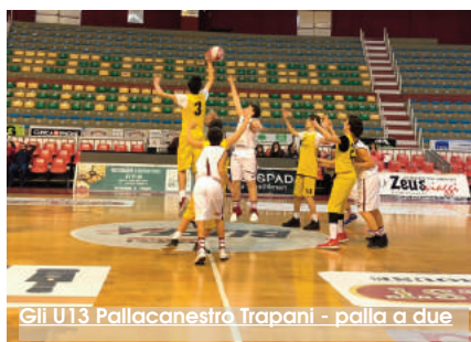
Gli U13 Pallacanestro Trapani - palla a due