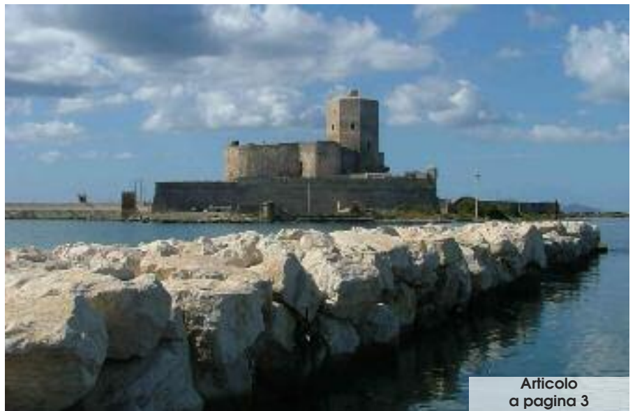
Articolo a pagina 3