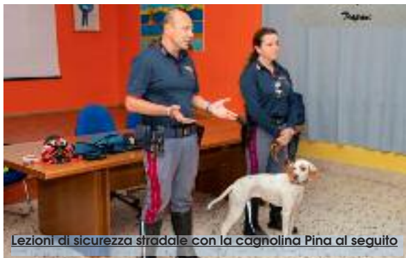
Lezioni di sicurezza stradale con la cagnolina Pina al seguito

Dai giovanissimi alunni delle scuole dell'infanzia della provincia di Trapani agli studenti delle scuole secondarie di secondo livello, la Polizia Stradale con il progetto "Icaro" ha sensibilizzato adulti e bambini sulle tematiche della sicurezza stradale e sui pericoli di una guida senza regole. Giunto alla 19esima edizione e conclusosi negli ultimi giorni, il progetto "Icaro" è nato da un'esigenza reale: contrastare decessi per incidenti stradali. In Italia - secondo i dati ACI/Istat 2017 (quelli del 2018 sono ancora nella fase preliminare di elaborazione, ndr) ci sono stati più morti rispetto all'anno precedente (+2,9%), nonostante un lieve calo di sinistri e feriti (rispettivamente -0,5 e -1%). È l'impietosa immagine di un fenomeno che ha costi sociali pari a 19,3 miliardi di euro