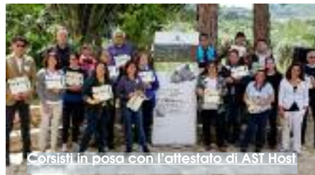
Corsi in posa con l'attestato di AST Host

Dopo la conclusione del Corso ASTA-Alta Scuola di Turismo Ambientale in cui, tra le altre cose, sono state affrontate tematiche relative alla valorizzazione del turismo sostenibile e offerte le competenze per valorizzare le risorse ambientali e le comunità locali, è stato indetto un nuovo incontro dal 20 al 25 maggio prossimi, presso Palazzo Oceania a Trapani. Il corso "Host. Avviamento e gestione strutture turistiche" sarà diretto da Saverio Panzica, esperto del settore, e offrirà un quadro della normativa in ambito turistico e un valido sostegno per tutti gli adempimenti burocratici e fiscali indispensabili per avviare e gestire le strutture ricettive e le locazioni turistiche. Il corso Host è anche uno strumento per migliorare le competenze di coloro che già operano nel settore, nel rispetto della legalità e della libera concorrenza. Tali argomenti saranno articolati in moduli, alcuni inerenti anche alla gestione Web e alle norme edilizie. Per informazioni e iscrizioni, è possibile rivolgersi alla segreteria di AlfaMedia Italia all'indirizzo email info@alfamediaitalia.it, oppure contattare numeri di telefono 335 6497432 - 336 549451. (M.P.)