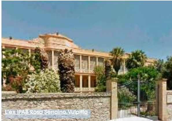
L'ex IPAB Rosa Serraino Vulpitta