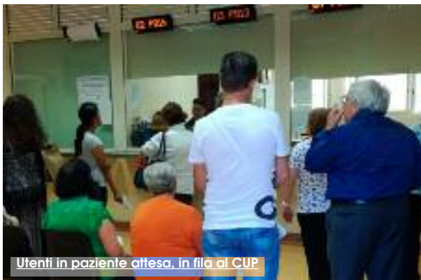
Utenti in paziente attesa, in fila al CUP

Sono le 15,00 esatte del pomeriggio quando mi dirigo al Centro Unificato di Prenotazione dell'ASP di Trapani presso la Cittadella della Salute per prenotare una visita ed effettuare un pagamento; "mea culpa" (lo ammetto) avrei potuto fruire dell'efficiente piattaforma on line messa a disposizione dall'ASP, ma nella precisa circostanza (per cause esterne) ho avuto bisogno di interfacciarmi con una persona fisica piuttosto che con un computer. Secondo la prassi prevista, mi do del ticket, rilasciato dal totem. La voce è "prenotazione + cassa", lo sportello B, per l'esattezza. Mi viene rilasciato il numero 197 (davanti a me ci sono circa 40 persone. Quando controllo il monitor su cui vengono mostrati gli avanzamenti numerici, sono le 15,12. Gli utenti allo sportello