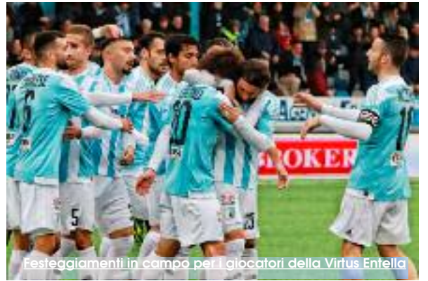
Festeggiamenti in campo per i giocatori della Virtus Entella

«Il girone A è quello che ho disputato e ci sono squadre veramente forti. Il Novara, ad esempio, si è qualificata tra le ultime per i playoff ed è una formazione terribile da affrontare. Pro Vercelli e Pisa sono molto forti a livello tecnico e tattico. Il livello è molto alto. Il girone B l'ho seguito pochissimo. Naturalmente ho visto il girone C dove ci sono il Trapani e il Catania che sono attrezzate. Il Trapani ha fatto un miracolo: partito per come era partito e inseguire la Juve Stabia non era facilissimo. Ho visto qualche partita dei granata e giocano molto bene. Secondo me il Trapani può dire la sua. L'unica incognita è ciò che accadrà a livello societario, di cui però non conosco le vi-