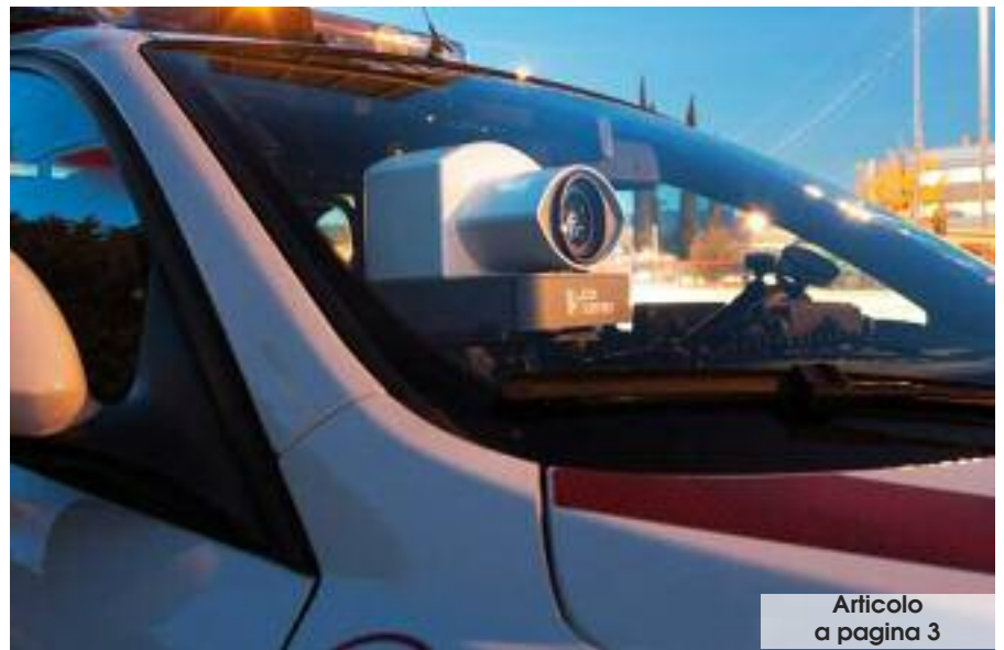
Articolo a pagina 3