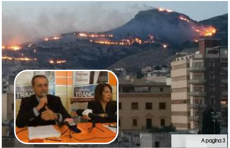
A pagina 3