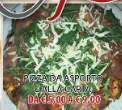
PIZZA DA ASPORTO E ALLA CARTA DA €5,00 A €9,00