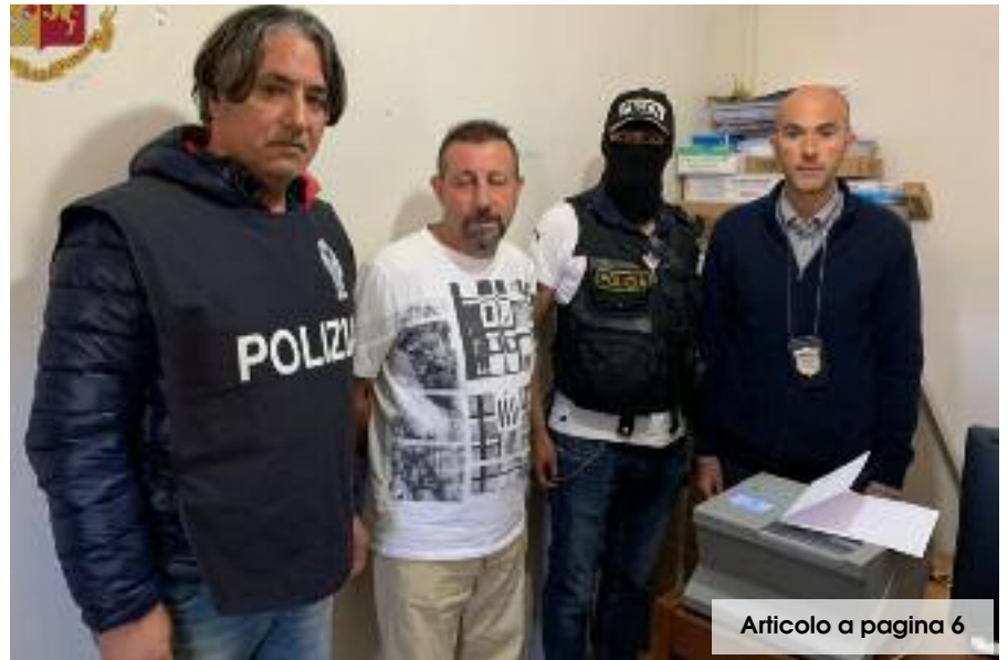
Articolo a pagina 6