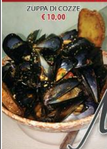
ZUPPA DI COZZE €10,00