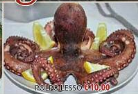
POLPO LESSO €10,00

Via S. Cristoforo, 5/7/9 - Trapani (Zona porto, di fronte aliscafi) Tel. 328 734 7738 - Tel. 348 722 0533