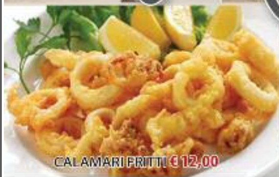
CALAMARI FRITTI €12,00