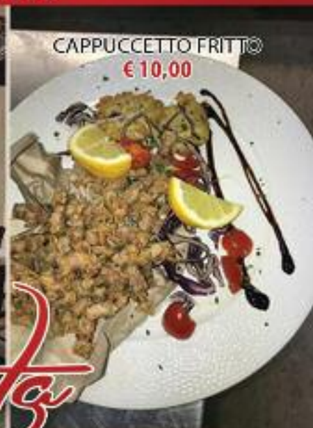
CAPPUCCETTO FRITTO €10,00