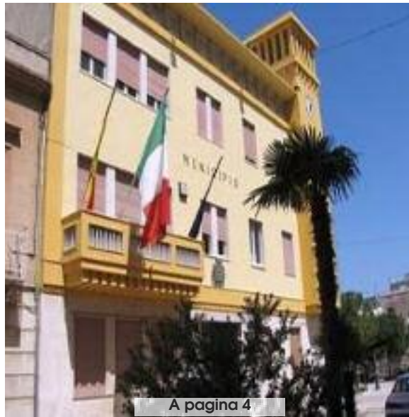
A pagina 4