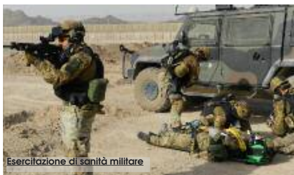
Esercitazione di sanità militare

Il 6 Reggimento Bersaglieri ospita stamane, presso la Caserma “Luigi Giannettino”, un Seminario dedicato all'Assistenza sanitaria in Aree di crisi. L'incontro che prevede un approfondimento accademico sul programma “Health Care in Danger” e alle Regole di Ingaggio (RoE), applicate al personale militare in operazione all'estero, si concluderà con una simulazione pratica di attacco a convoglio umanitario ed evacuazione dei feriti, presso il Posto Medico Avan-