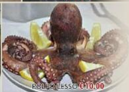
POLPO LESSO € 10,00