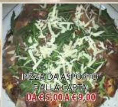
PIZZA DA ASPORTO E ALLA CARTA DA € 5,00 A € 9,00