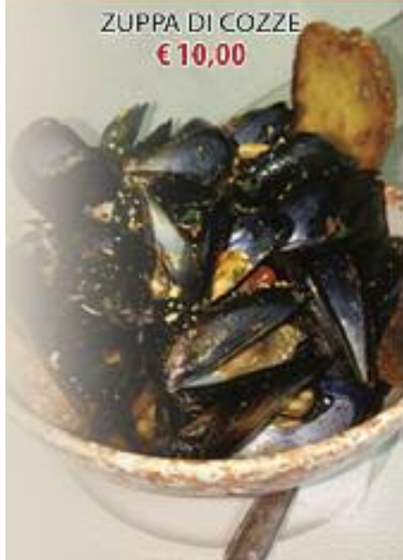
ZUPPA DI COZZE € 10,00