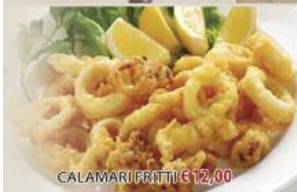
CALAMARI FRITTI € 12,00