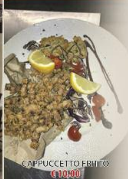
CAPPUCCETTO FRITTO € 10,00