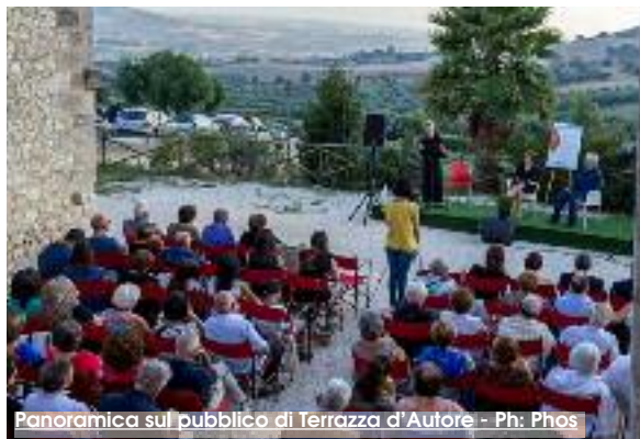
Panoramica sul pubblico di Terrazza d'Autore