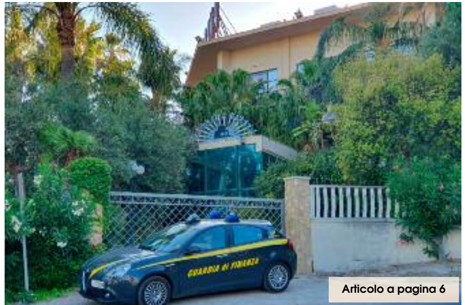
Articolo a pagina 6