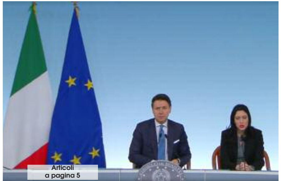
Articoli a pagina 5