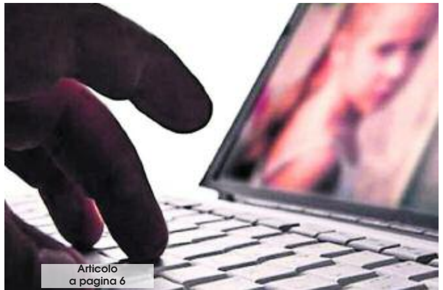
Articolo a pagina 6