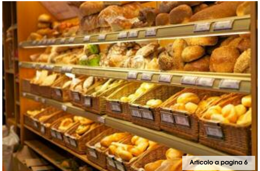
Articolo a pagina 6