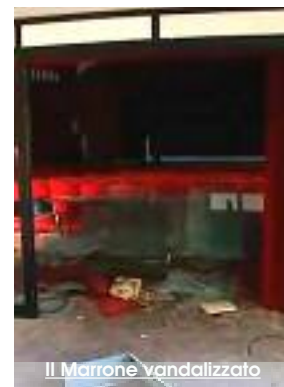
Il Marrone vandalizzato

La Regione nel 2016 era disponibile ad affidarlo gratuitamente al luglio musicale, quale maggiore soggetto in zona abilitato alla gestione artistica della struttura. Il sindaco di Erice dell'epoca scrisse per bloccare l'affidamento, rivendicando il suo diritto di prelazione. MAI Esercitato. Il luglio in quel momento era assolutamente in grado con proprie risorse di ripristinare le norme di sicurezza per la riapertura al pubblico del teatro marrone. Oggi a 3 anni di distanza i comuni continuano ad essere inadempienti e i costi ovviamente lievitati. INVITO le forze politiche, in mondo dell'associazionismo, tutti coloro a cui sta a cuore la cultura della nostra città a farsi sentire. Anche con